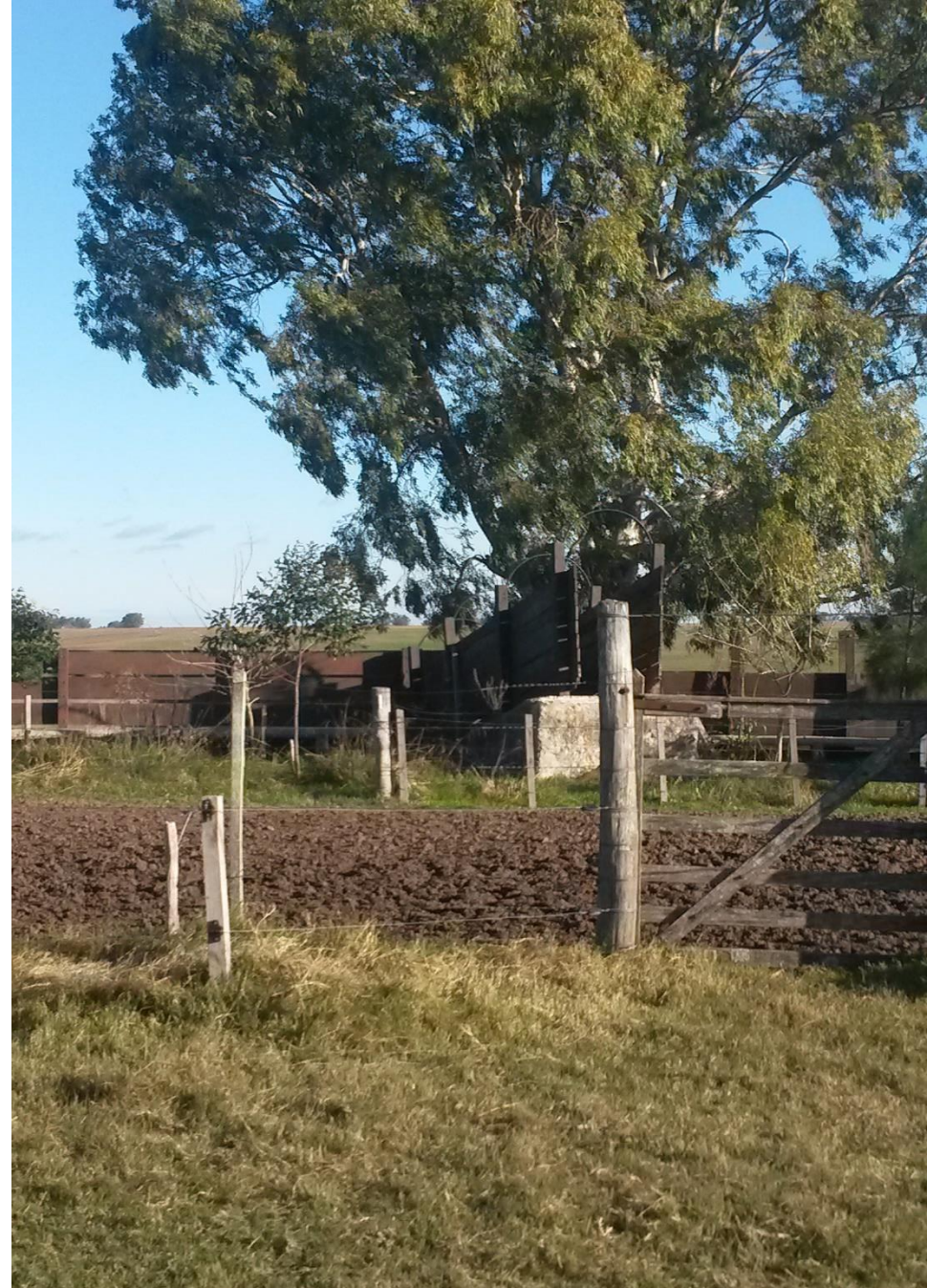
GUILLEMO ARRILLAGA negocios rurales