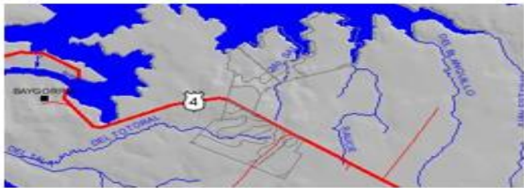
CROQUIS DE GRUPOS DE SUELOS CONEAT